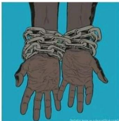
La mémoire de l'esclavage

A l'occasion de la réouverture de la MDL: présentation de l'exposition "En finir avec la traite, en finir avec l'esclavage"