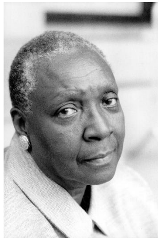
Maryse CONDÉ (Notre marraine)